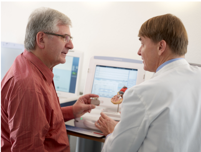
Telekardiologie ermöglicht die Übertragung wichtiger Herzdaten direkt an den Arzt